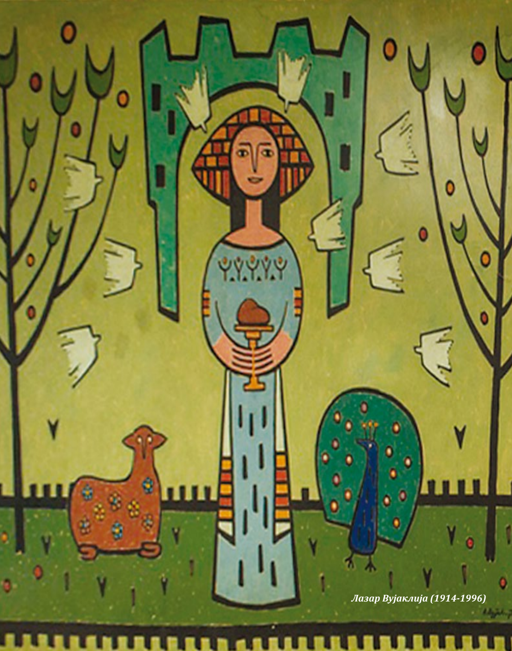
Лазар Вујаклија (1914-1996)