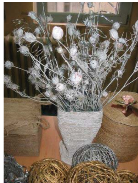
Novogodišnja izložba radnih terapeuta IMZ