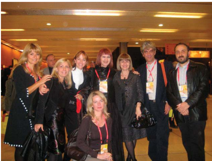
XIV World Congress of Psychiatry, 20-25 September 2008, Prague